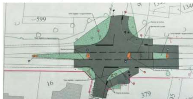
Sortie ou entrée du chemin des Prises.

T reize ans d'études, de tergiversations et de recherche de solutions. Le maire n'y croyait plus quand, enfin, le Département a validé le projet de sécurisation de la traversée de la départementale par les cyclistes en quatre points, dont deux au moins devraient être prêts pour les prochaines vacances d'été.