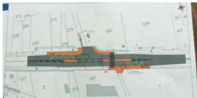
Traversée depuis ou vers le camping Le Puma.