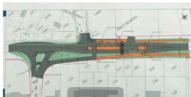
Gestion du stationnement des bus et de la circulation depuis et vers la rue de Botchey en parallèle des Bardes.